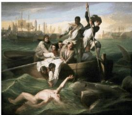
John Singleton Copley. Watson and the Shark. 1778. National Gallery of Art (Washington, United States).